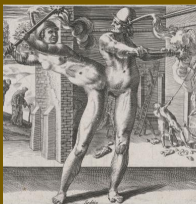
Seditio (opstand), prent van D.V. Coornhert

Vanaf de 16 e eeuw krijgen de meeste staten van West-Europa te maken met religieuze verdeeldheid onder de bevolking. Politieke onrust escaleert weldra in oorlog en burgeroorlog. Meestal kiest men voor repressie, verdraagzaamheid is de grote (meestal tijdelijke) uitzondering.