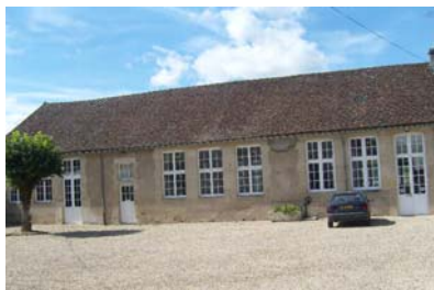
Salle de fêtes

Voor onze uiteenzettingen maken wij gebruik van het werk van (o.a.) M. Heidegger, J. Habermas, M. Foucault, Ch. Taylor en (zoals gezegd) M. Nussbaum. Ter voorbereiding op de cursus krijgt u een syllabus toegestuurd. Het sociale programma voorziet in twee films die raken aan onderwerpen uit de cursus. Ook de wandelingen zijn thematisch verantwoord.