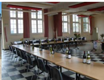
Salle de fêtes cursusopstelling