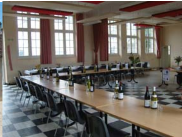
Salle de fêtes cursusopstelling