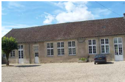
Salle de fêtes

Ter voorbereiding op de cursus krijgt u een syllabus toegestuurd. Het sociale programma voorziet in een tweetal films die raken aan onderwerpen uit de cursus. Ook de wandelingen en de maaltijden zijn thematisch verantwoord.