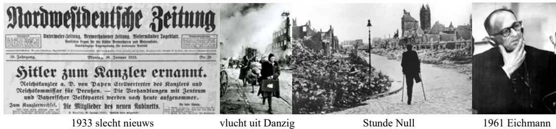
1933 slecht nieuws