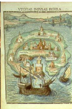
Utopiae insulae figura