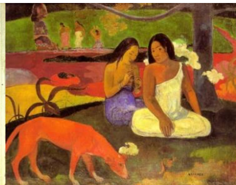
Paul Gauguin, Arearea (1892)

Het mag zo zijn dat wij spontaan en graag samenleven, het is niet minder bekend dat conflicten, in alle soorten en maten, het vreedzaam samenleven vaak ernstig verstoren. Staten en steden strijden dan met elkaar om de hegemonie, mensen bestrijden elkaar onderling, ook de visie op 'het goede leven' en 'de samenleving' is inzet van felle strijd. De grote regelmaat van oorlog, burgeroorlog, verkettering, onderdrukking, uitbuiting, uitsluiting en alledaagse onverdraagzaamheid en vijandigheid doet nogal eens betwijfelen of vrede en vreedzaam samenleven wel de norm kan zijn. Ook de antieke filosofen wisten al dat het menselijk samenleven, hoe natuurlijk het dan ook mag zijn, allerm minst vanzelf gaat, dat de politieke organisatie van de samenleving kunst en vliegwerk is, dat de politiek soms zelf het probleem is en allerm minst perfect. Zo komen we dan ook al vroeg het ideaal van een 'goed leven' bezijden de politiek tegen.