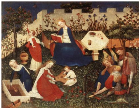
Paradijsstuin, Rijnlandse school ± 1410

Het 'samenleven' is ons mensen op het lijf geschreven. We kunnen niet anders, we willen niet anders, we kunnen niet anders willen. Geen lijfsbehoud zonder samenleving. Mensen zijn op elkaar aangewezen, hebben elkaar nodig, ook in de volwassen jaren. Het is echter niet enkel de eigen behoefte die ons naar elkaar toe drijft, want ook omwille van levensvreugde en zingeving zoeken wij elkaar op: geen 'goed leven' zonder samenleven. De mens is een sociaal wezen, zijn 'sociabiliteit' is een antropologisch basisfeit. In de antieke filosofie heet de mens een 'politiek dier' (Gr. zoön politikon ) dat enkel in de polis (stadsstaat) zijn voltooiing vindt. In de politieke samenleving bereikt onze natuurlijke aanleg zijn perfectie.