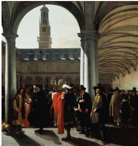
Emanuel de Witte De binnenplaats van de beurs te Amsterdam