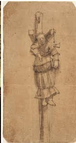
Rembrandt Elsje Christiaens

Dit zogenaamd typisch moderne 'zelf'-beeld, met zijn nadruk op individualiteit, eigenheid (authenticiteit, autonomie), rationaliteit, praktische alledaagsheid, zelfexpressie en zelfbeheersing, staat echter inmiddels volop ter discussie onder meer omdat zou zijn gebleken dat het een verkeerd ideaal is: het (samen)leven verarmt als alles draait om 'ik' en 'controle'. In lijn met deze kritiek klinkt ook in studies over de Renaissance en (vroeg) Verlichting een ander geluid door. Typisch voor die tijd is dan niet de ontdekking van het eigenzinnige individu, maar de opkomst van de sterke staat die om te functioneren brave burgers nodig heeft: mensen die zichzelf beheersen. Zelfbeheersing en rationaliteit zijn zo gezien geen eigenschappen van het vrije individu, maar elementen van een machtsstrategie om een samenleving te disciplineren.