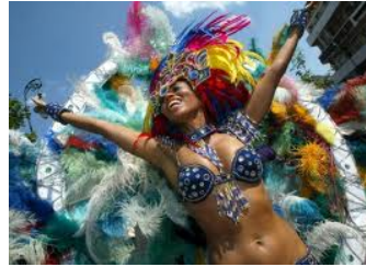
Karneval der Kulturen