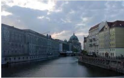
Bocht in de Spree