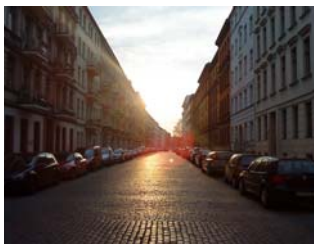
In het oosten komt de zon op

De opzet van deze cursus is anders dan gebruikelijk in Frankrijk. De reden is dat wij ook willen profiteren van de stad. We handhaven de bijeenkomsten 's ochtends. Voor de liefhebbers komen we bovendien een middag samen voor tekstlezing en discussie. Ook vrijdagmiddag komen wij bijeen om de cursus inhoudelijk af te sluiten, bij mooi weer op een terras in het nabij gelegen Görlitzer Park. Voor het overige hebben wij een programma in de grote stad Berlijn. Dat programma bestaat uit lunches en diners, wandelingen en fietstochten, museum-, theater-, bioscoop, cafébezoek, etc. Deelname aan (onderdelen van) dit programma is à volonté . We laten u tijdig weten was läuft, dreht, spielt, tanz und singt in Berlin . Uw vondsten en suggesties zijn uiteraard ook welkom. Ik ga er vanuit dat wij voor bepaalde activiteiten telkens groepjes samenstellen. Wie er alleen op uit wil gaat zijn eigen weg. Op zondag en vrijdag dineren we gezamenlijk.