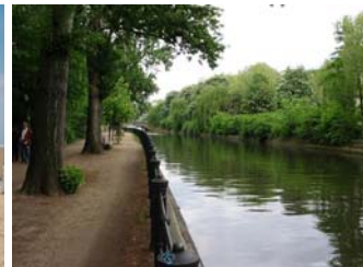
Wandelen in Kreuzberg