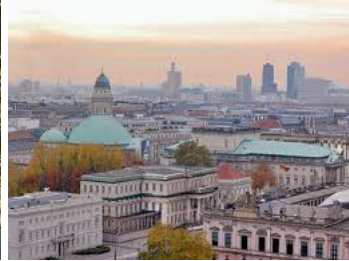
Der Himmel über Berlin