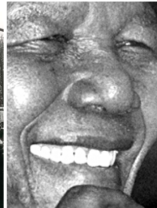
Mandela: einde apartheid