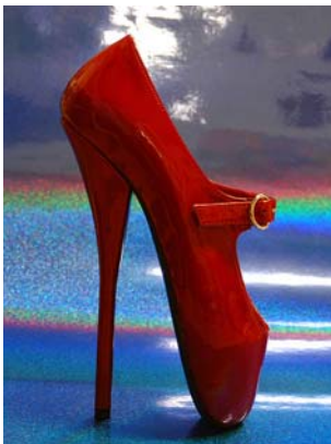
Schoen met hoge hak

“De angst voor deze mensen heeft me verschrikkelijk oppervlakkig gemaakt.” P. Mercier