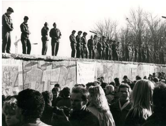
Bij de val van de Berlijnse Muur