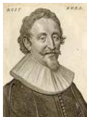
H. de Groot/Grotius