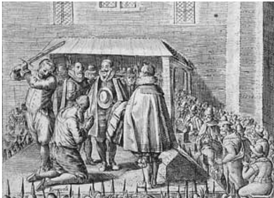
De onthoofding van Johan van Oldenbarnevelt 1619

rondom kwesties van religie, ethiek en politiek een specifieke manier van denken ontwikkelen. Met name de kwestie van religievrede en verdraagzaamheid verhit dan de gemoederen en dwingt voortdurend stellingname en overdenking af. Deze auteurs spreken in eerste instantie in theologische termen over een geloofskwestie . Interessant is echter dat in hun werk langzamerhand de contouren van een filosofisch taalspel en een seculiere problematiek zichtbaar worden. Illustratief voor deze ontwikkeling is het scherpe woord van Hugo de Groot: prius est bonum civem esse quam bonum christianum (om een goed christen te zijn moet je eerst een goede burger zijn). Het is onze bedoeling aan de hand van de kwestie van de