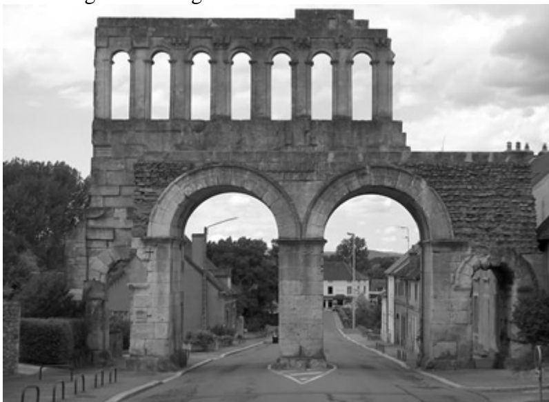
Via de Porte d'Arroux verlaat u Autun als u naar Chissey wilt!

Zodra wij uw aanbetaling ad €250,- hebben ontvangen (rekeningnummer 1796572 van Tekst & Uitleg, Deventer, o.v.v. FiF-Spinoza) bent u ingeschreven. Het resterende bedrag betaalt u bij aankomst. Bij een tekort aan deelnemers krijgt u daarvan uiterlijk 1 augustus bericht en storten wij uw aanbetaling direct terug.