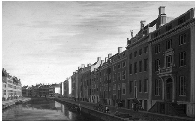
Amsterdam, die mooie stad, is gebouwd op palen ...

verdraagzaamheid deze ontwikkeling van(uit) de theologie naar de filosofie uiteen te zetten. Auteurs die aan de orde komen zijn Erasmus (ca. 1466-1536), Coornhert (1522-1590) en Grotius (1583-1645). In een intermezzo behandelen wij de tolerantie-opvatting van de Engelse filosoof John Locke (1632-1704), die lange tijd in de Republiek leeft en er zijn belangrijkste werken schrijft. Eveneens in een intermezzo gaan wij in op de historische context: de motieven van de Opstand (tegen Spanje), het staatsbestel, de godsdienstpolitiek en de politieke crises van de Republiek.