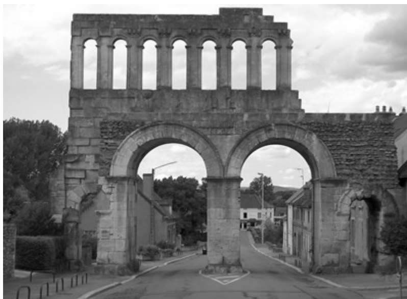
Via de Porte d'Arroux verlaat u Autun als u naar Chissey wilt!