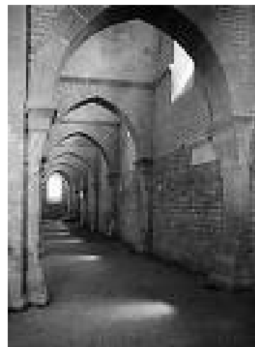
Montbart Abbaye de Fontenay