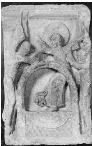
Autun St. Lazare

De Bourgogne bezit een overvloed aan Romaanse bouwkunst, grote kerken zoals de Sainte Madeleine in Vezelay, de Saint Lazare in Autun (beide beroemd om hun kapitelen), de Saint Philibert in Tournus en de cisterciënzer abdij van Fontenay. Maar u treft ook kleinere oude kerkjes aan in dorpjes waar het altijd goed toeven is.